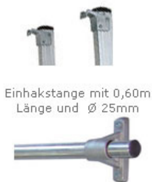
Einhakstange mit 0,60m Länge und \varnothing 25mm